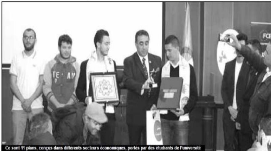
Ce sont 11 plans, conçus dans différents secteurs économiques, portés par des étudiants de l'université

L e Forum des chefs d'entreprise (FCE) s'était récemment déclaré prêt à accompagner les jeunes diplômés porteurs de projets pour mettre au point leurs institutions. C'est chose faite depuis jeudi dernier, où l'initiative intitulée « Le challenge entrepreneur de l'avenir » a pris forme à l'occasion de la clôture. Ainsi, ce sont 11 plans, conçus dans différents secteurs économiques, portés par des étudiants de l'université M'hamed Bouguerra de Boumerdes (Umhb), qui seront accompagnés jusqu'à concrétisation et les meilleurs, trois premiers lauréats, sélectionnés parmi une centaine d'idées d'étudiants, bénéficieront d'un financement allant jusqu'à un million/DA. La 2ème phase de cette manifestation s'est clôturée jeudi en présence du wali de Boumerdes, Abderrahmane Madani Foustah et des vice-présidents du Forum des chefs d'entreprise, Mohamed Bahr et Nacora Haddad. Cette compétition était destinée essentiellement aux étudiants de l'Umhb, porteurs de projets jusqu'à la date de jeudi 26. Au départ de ce concours, 80 projets étudiants ont concouru, dont 23 ont été sélectionnés sur lesquels seulement 11 projets ont été retenus par un jury. Les étudiants, porteurs de ces 11 projets, seront accompagnés jusqu'à leur concrétisation, par le FCE. Différents secteurs concernés comme les dispositifs d'aide à la création d'entreprises, les banques et la direction de l'emploi de la wilaya de Boumerdes et ses services y apporteront leur soutien.